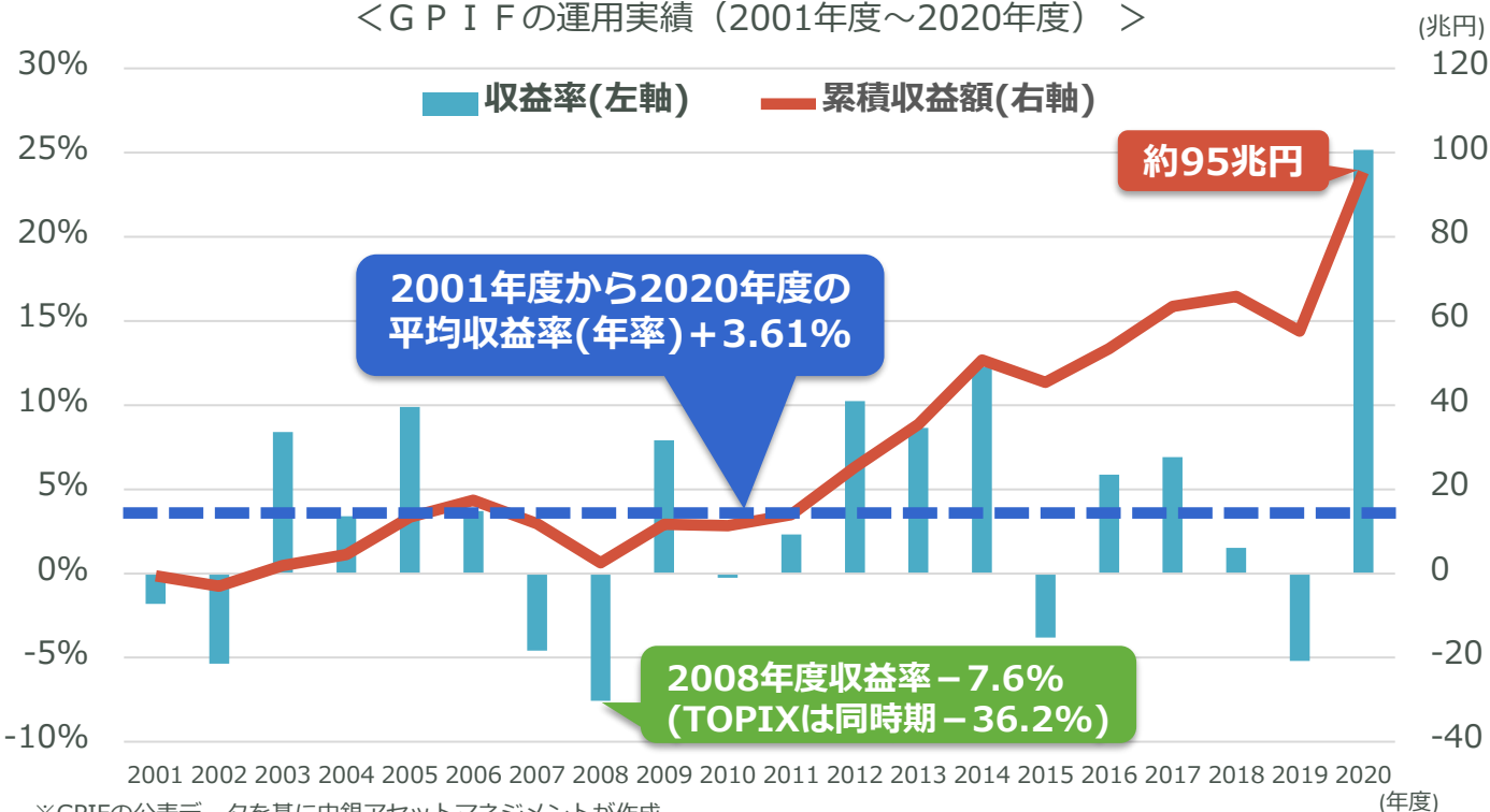
<GPIFの運用実績（2001年度～2020年度）>